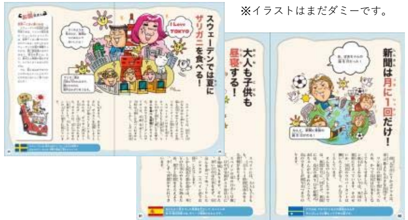
※イラストはまだダミーです。

【構成】 1章 食べ物のいろいろがスゴすぎ！ 2章 お店やお仕事のいろいろがスゴすぎ！ 3章 学校のいろいろがスゴすぎ！ 4章 おうちや乗り物がスゴすぎ！ 5章 スポーツや行事のスゴすぎ！ 6章 こんなものあり！？ルールやマナーがスゴすぎ！ コラム ・びっくりギョー天！？世界の食事(手を使って食べる国が実は一番多い、) ／世界のコイン(正方形や六角形の硬貨など、珍しいお金)など×6本 ・外国人から見た日本のびっくりギョー天！？×4本